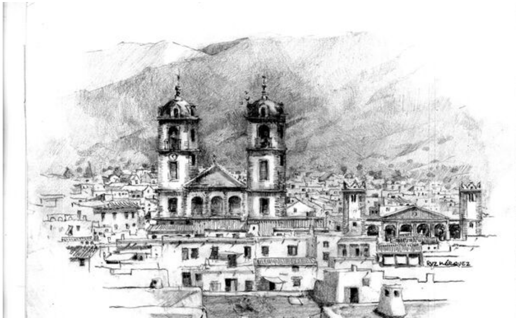
Imagen panorámica de Berja. Dibujo José Luis Ruz

Celebrando la marcha del francés se hallaba Berja cuando en 16 de octubre de 1812 llega el alcalde mayor y juez de primera instancia del partido y con él la proclamación de la primera Constitución, la Pepa por el día de este año de su nacimiento en Cádiz.