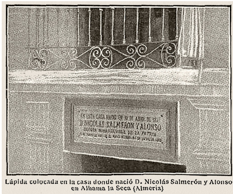
Imagen inscripción conmemorativa en honor de Nicolás Salmerón en su domicilio familiar. Revista Nuevo Mundo , 24 de septiembre de 1908, p.12.